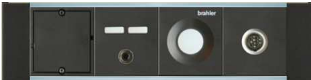
Anwendungsbeispiel mit Kopfhöreranschluss

Artikel-Nr.: 05.1211.32/05.1211.32.CH – 05.1212.32/05.1212.32.CH – 05.1213.32/05.1213.32.CH