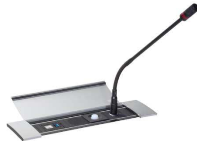
Anwendungsbeispiel Power Frame Cover Aluminium

Für das Custom-Chassis sind folgende Einsätze erhältlich: