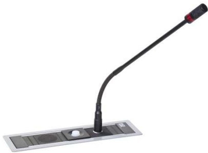
Anwendungsbeispiel Power Frame silver-grey

Keine Audio-Wiedergabe an Stelle des Kopfhöreranschlusses. Artikel-Nr.: 05.1211.32